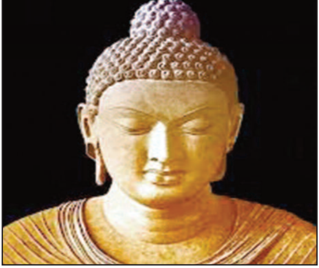
ਅਦਾਰਾ 'ਅੰਬੇਦਕਰ ਟਾਈਮਜ਼' ਅਤੇ 'ਦੇਸ਼ ਦੁਆਬਾ' ਵੱਲੋਂ ਬੁੱਧ ਪੂਰਣਿਮਾ ਲੱਖ-ਲੱਖ ਵਧਾਈਆਂ। ਇਸ ਸ਼ੁਭ ਦਿਹਾੜੇ 'ਤੇ ਸ. ਫਤਿਹਜੰਗ ਸਿੰਘ ਦਾ ਵਿਸ਼ੇਸ਼ ਲੇਖ ਦੇਖੋ ਸਫ਼ਾ 15, 16 ਤੇ

ਮੁੱਖ ਸੰਪਾਦਕ : ਪ੍ਰੇਮ ਕੁਮਾਰ ਚੰਬਰ ਸੰਪਰਕ : 916-947-8920 ਫੈਕਸ : 916-238-1393 E-mail : deshdoaba@yahoo.com ਸੰਪਾਦਕ : ਤਰਸੇਮ ਜਲੰਧਰੀ