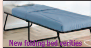
New folding bed varieties

Loose Fabrics, Groceries, Blankets, Vegetables