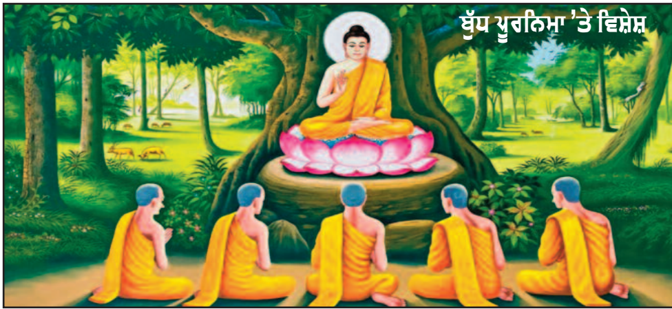
ਬੁੱਧ ਪੂਰਨਿਮਾ 'ਤੇ ਵਿਸ਼ੇਸ਼

ਚੀਨੀ ਭਿਕਸ਼ੂ ਯੋਨਚਾਂਗ ਜੋ ਭਾਰਤ ਦੀ ਯਾਤਰਾ ਤੇ ਆਇਆ ਸੀ, ਲਿਖਦਾ ਹੈ ਕਿ ਦੂਜੀ ਈਸਵੀ ਨਾਲੰਦਾ ਵਿਸ਼ਵਵਿਦਿਆਲੇ ਦੀ ਸਥਾਪਤੀ ਤੋਂ ਲੈ ਕੇ 750 ਈਸਵੀ ਤੱਕ ਇਸ ਵਿਚ ਬੁੱਧ ਗ੍ਰੰਥ ਪੜ੍ਹਾਏ ਜਾਂਦੇ ਰਹੇ ਹਨ। ਬਾਰਾਂ ਸੌ ਵਰ੍ਹਿਆਂ ਤੱਕ ਏਸ਼ੀਆ ਦੀ ਮੰਨੀ ਪ੍ਰਮਾਣੀ ਯੂਨੀਵਰਸਿਟੀ ਰਹੀ ਹੈ ਜਿਸ ਵਿਚ ਦੇਸ਼ ਦੇਸ਼ਾਂਤਰਾਂ ਤੋਂ ਵਿਦਿਆਰਥੀ ਪੜ੍ਹਨ ਆਉਂਦੇ ਸਨ। ਕਈ ਦੇਸ਼ਾਂ ਦੇ ਰਾਜਿਆਂ ਨੇ ਯੂਨੀਵਰਸਿਟੀ ਦੇ ਨਾਂ ਜਗੀਰਾਂ ਲੁਆਈਆਂ ਹੋਈਆਂ ਸਨ ਤਾਂ ਜੋ ਰੱਟੀ ਕੱਪੜੇ ਦਾ ਖਰਚ ਚਲਦਾ ਰਹੇ। ਯੂਨੀਵਰਸਿਟੀ ਵਿਚ ਸਾਢੇ ਅੱਠ ਹਜ਼ਾਰ ਵਿਦਿਆਰਥੀ ਡੇਢ ਹਜ਼ਾਰ ਪ੍ਰੋਫੈਸਰ ਸਨ। ਹਰ ਰੋਜ਼ ਇਕ ਸੌ ਲੈਕਚਰ ਵੱਖ ਵੱਖ ਵਿਸ਼ਿਆਂ ਤੇ ਹੁੰਦੇ ਸਨ। ਸੰਸਾਰ ਦੀ ਹਰ ਵਿਦਿਆ ਬਿਨਾਂ ਪੱਖਪਾਤ ਦੇ ਪੜ੍ਹਾਈ ਜਾਂਦੀ ਸੀ। ਲਾਇਬ੍ਰੇਰੀ ਵਿਚ 20 ਲੱਖ ਤੋਂ (ਬਾਕੀ ਅਗਲੇ ਸਫੇ ਤੇ)