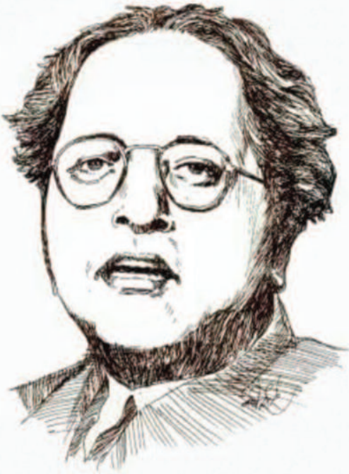
SAVIOR OF LABOUR RIGHTS DR. BHIMRAO AMBEDKAR